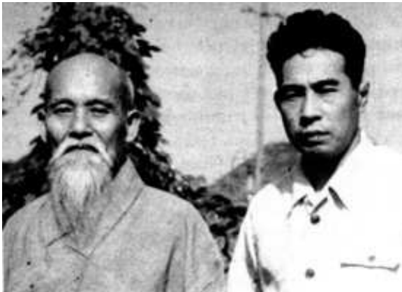
Morihei Ueshiba und Minoru Mochizuki